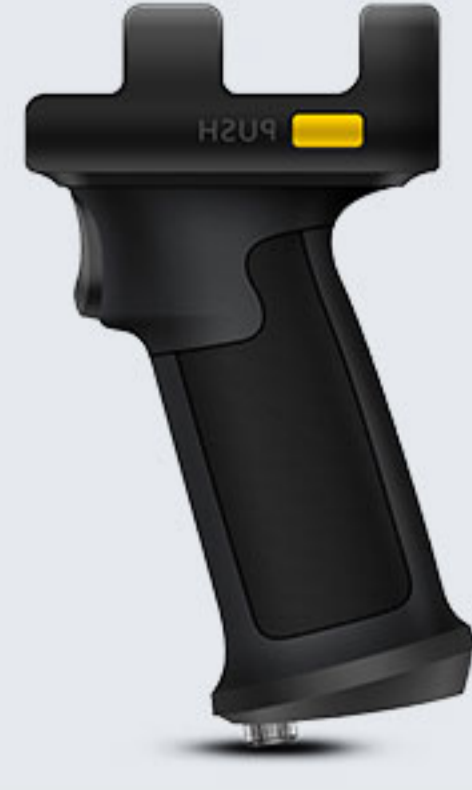
RB-C61-PS 手柄背夹，手柄按键可用于条码 触发，选配手柄电池