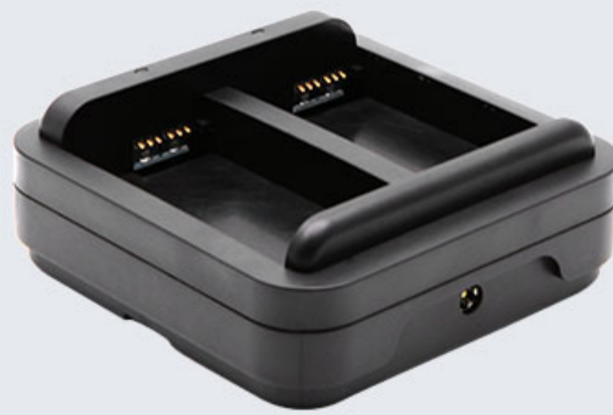
CRD-C61-MBC 主机电池2充，与适配器DCPWR-12V2A-XX 配套使用