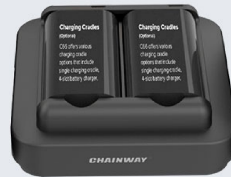
CRD-C61-PBC 手柄电池2充，与适配器DCPWR-12V2A-XX 配套使用