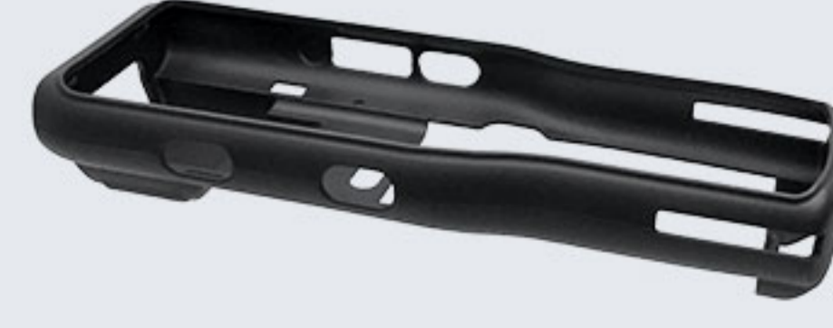
RB-C61-RR 保护胶套，支持充电底座 CRD-C61-RBC/CRD-C61-RBCE，与 腕带可以共存